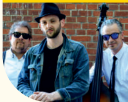
Weasel & The Cool Cats